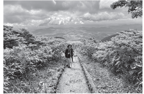
去年、6月5日の栗駒山様子

春になり会社からも遠くの船形山や栗駒山が綺麗に見える、空気の澄んだ季節になりました。